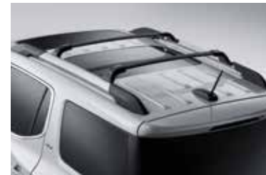
Barras transversales de techo