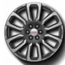
Rin DENALI 20" en aluminio