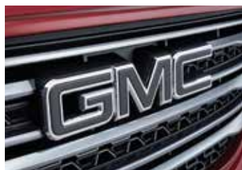
Emblema frontal en color negro