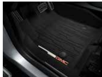
Tapete de vinil rígido frontal