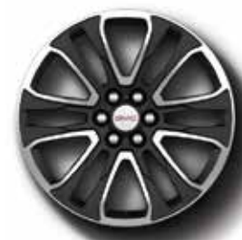
Rin AT4 20" en aluminio